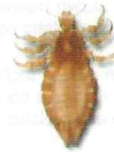
Pidocchio del capo